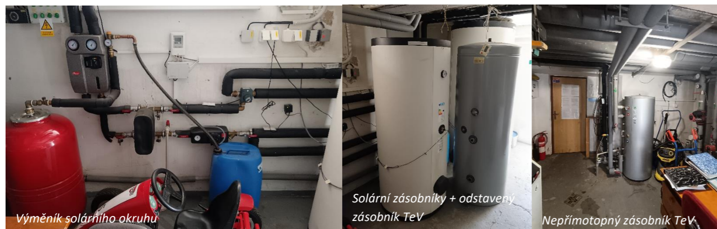
Výměník solárního okruhu

V současné době je solární ohřev teplé vody odstaven z důvodu jeho nefunkčnosti. Teplá voda je připravována pomocí plynových kotlů.